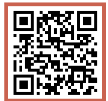
▲ 참가 신청 QR코드